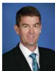
Représentant des grandes entreprises Paul Mitchell